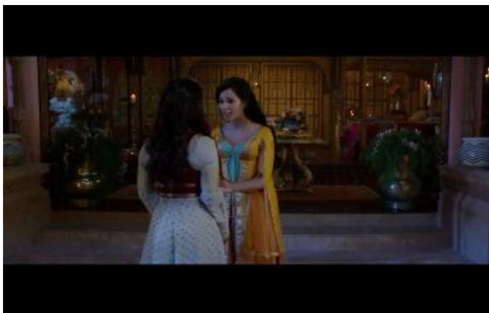
Gambar 6. Putri Jasmine Berdialog tentang Keinginannya Menjadi Sultan